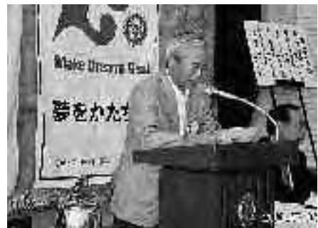
親睦委員会 初仕事 (出戻りではありません)