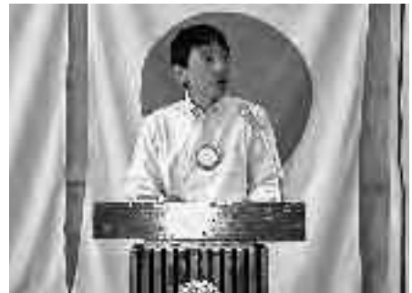
例会運営 初仕事 (久しぶり～)