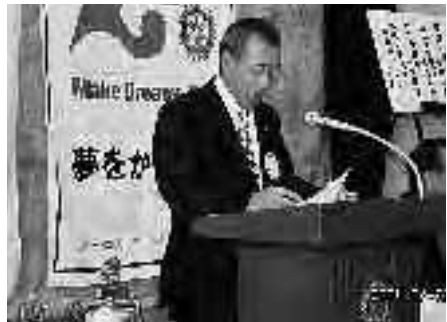
幹事 初仕事 (大変緊張しています)