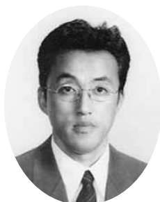
大嶋会長エレクト